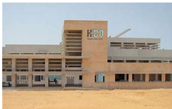
Hôpital Dalal Jam Dakar