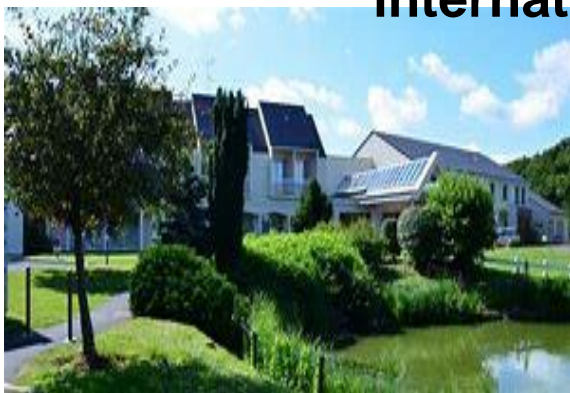
Centre Bois Gibert Tours

Actions de coopération inter-hospitalières internationales.